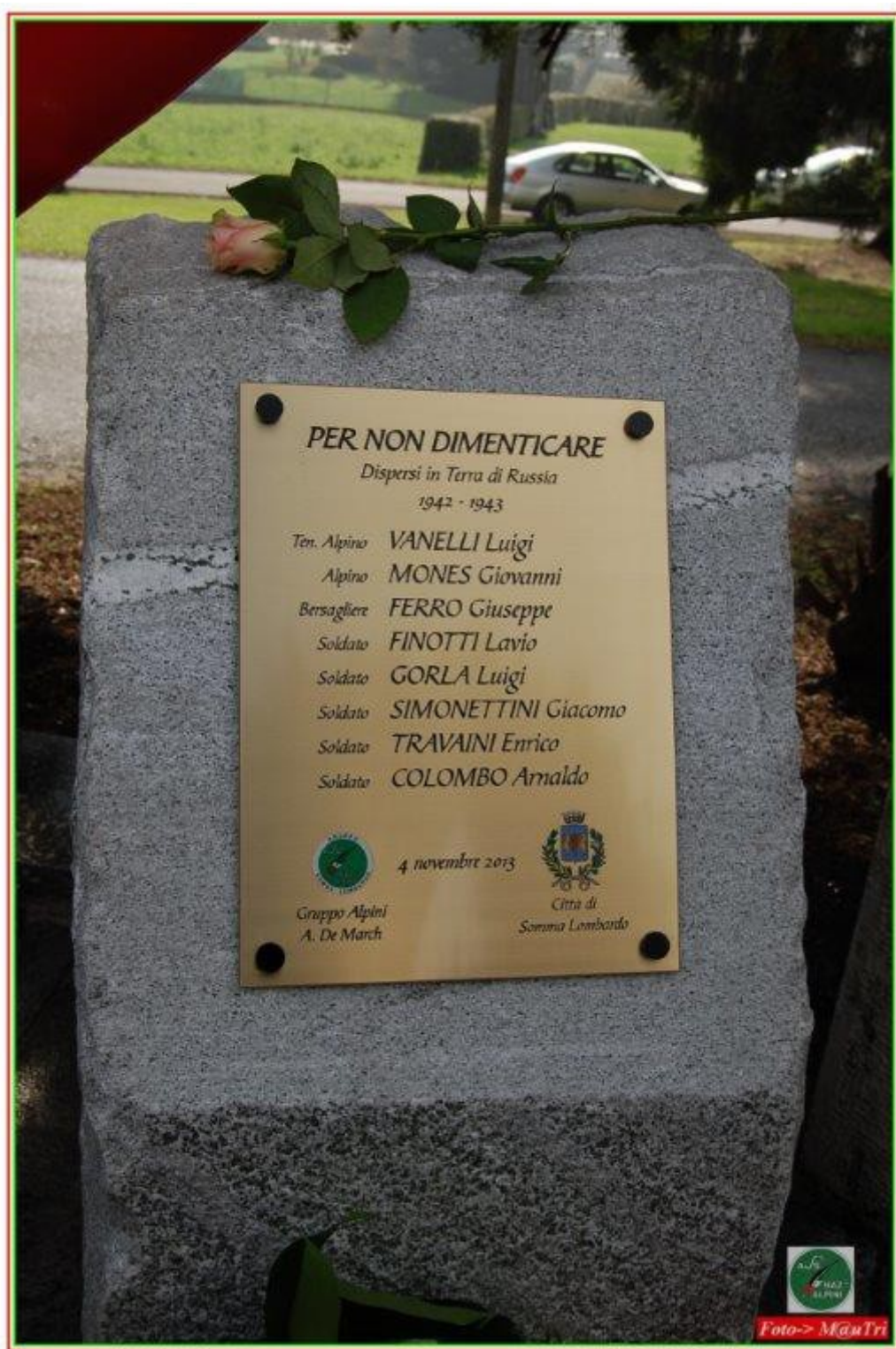
Lapide in ricordo dei cittadini Sommesi dispersi in Russia Mezzana di Somma Lombardo